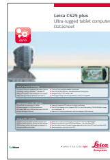
Leica CS25 Plus