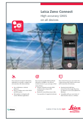
Leica Zeno Connect