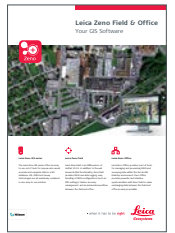
Leica Zeno Field et Office