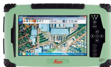
CS25 - TOUS MODÈLES