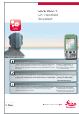
Leica Zeno 5

Microsoft, Windows® et le logo Windows sont des marques déposées de Microsoft Corporation aux USA et/ou dans d'autres pays.